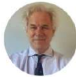
Mark Solms Neuropsychanalyst South Africa