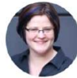
Emily Nagoski Psychologist and sexologist USA

Περισσότερες πληροφορίες EFT World Summit 2024