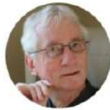
Frans de Waal Primatologist the Netherlands