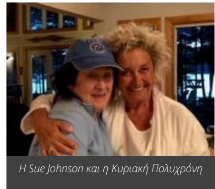
Η Sue Johnson και η Κυριακή Πολυχρόνη

Με πρόσκληση της Sue Johnson, ιδρύτριας της προσέγγισης EFT, ανταλλάξαν τις εμπειρίες τους από την χρονιά που πέρασε σχετικά με την εκπαίδευση και την θεραπεία, με στόχο να εμπλουτιστεί το μοντέλο. Στο φετινό retreat, η έμφαση ήταν στην εφαρμογή του EFT στην ατομική θεραπεία - EFIT.